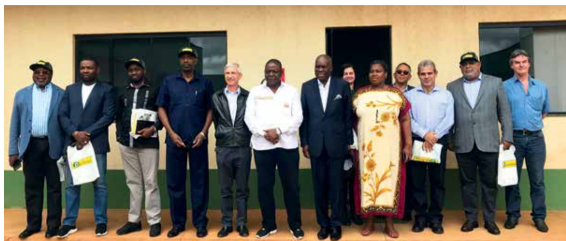
Grupo de angolanos visitou a região em 2017