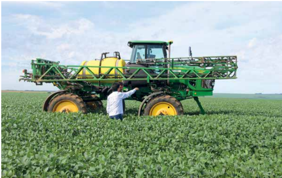
Tema da Feira será tecnologia