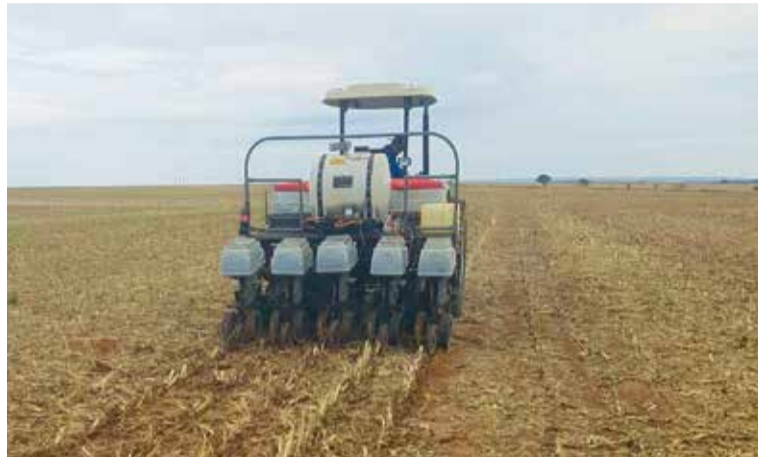
Área onde foram plantadas as cultivares para a competição