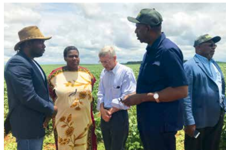
Empresários conheceram propriedades da região

Com essas visitas, a Agrobrasil pretende atrair técnicos, produtores e investidores estrangeiros para uma das maiores feiras do agronegócio brasileiro, favorecendo trocas comerciais e intercâmbio de culturas.