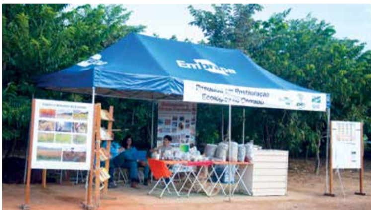
Estande da Embrapa no EVAF 2017