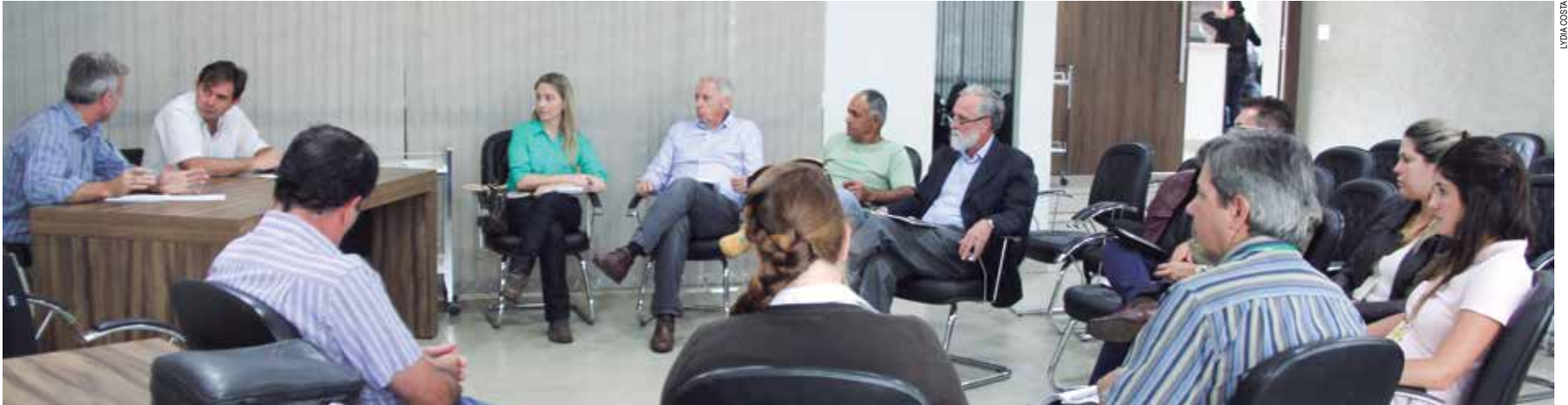
Entidades acertam detalhes para o Dia de Campo ILPF