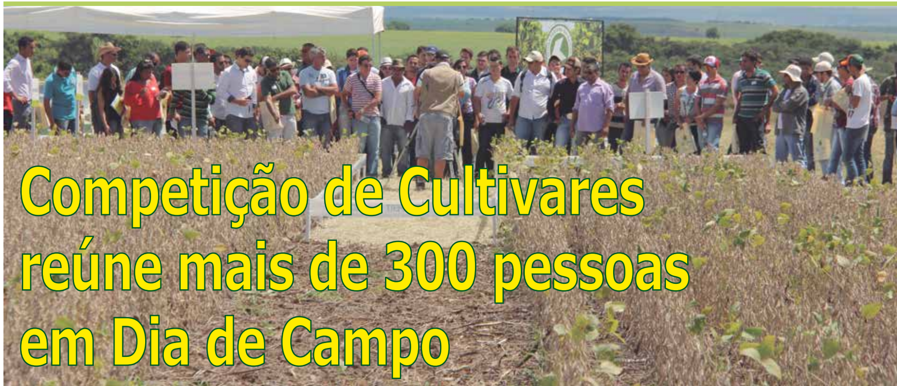
Participantes visitam estandes do evento