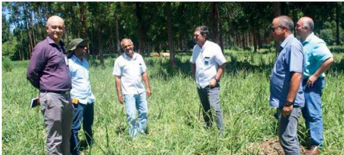
O ILPF já é espaço tradicional da Feira