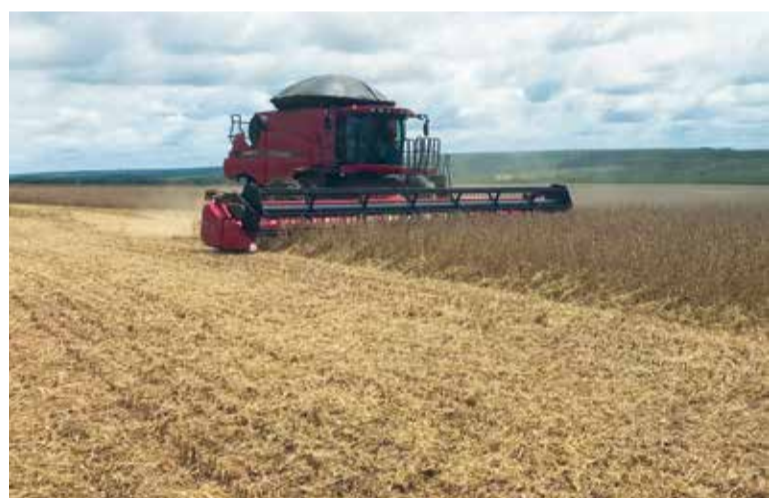
A expectativa é superar a safra anterior