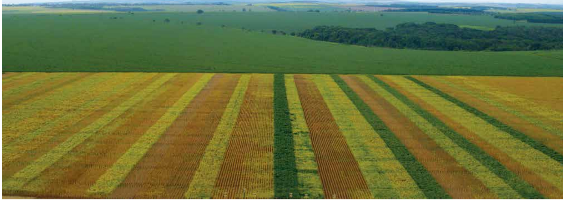
Área da Competição de Cultivares