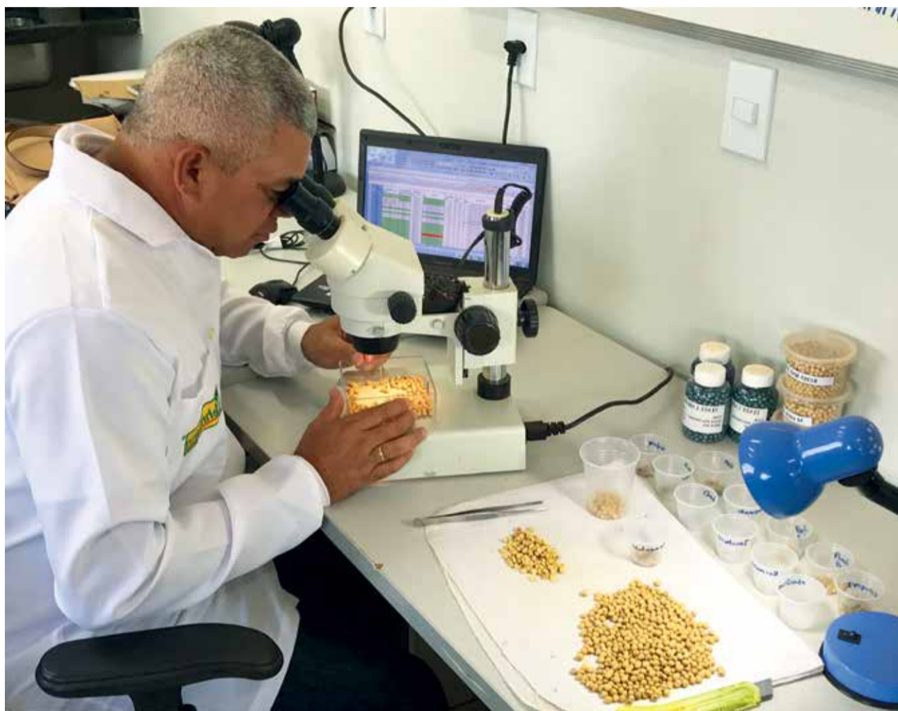
Tecnologia favoreceu o trabalho da empresa