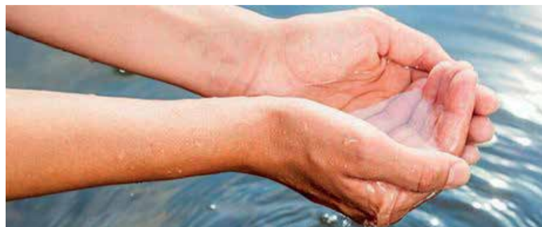
Fórum Mundial da Água será realizado em março