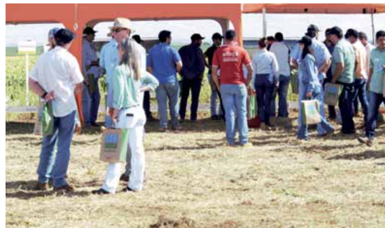
Dia de Campo reuniu empresas e produtores

O Dia de Campo foi uma mostra prévia dos resultados da competição, os quais serão divulgados no primeiro dia da AgroBrasília que, neste ano, será realizada de 15 a 19 de maio.