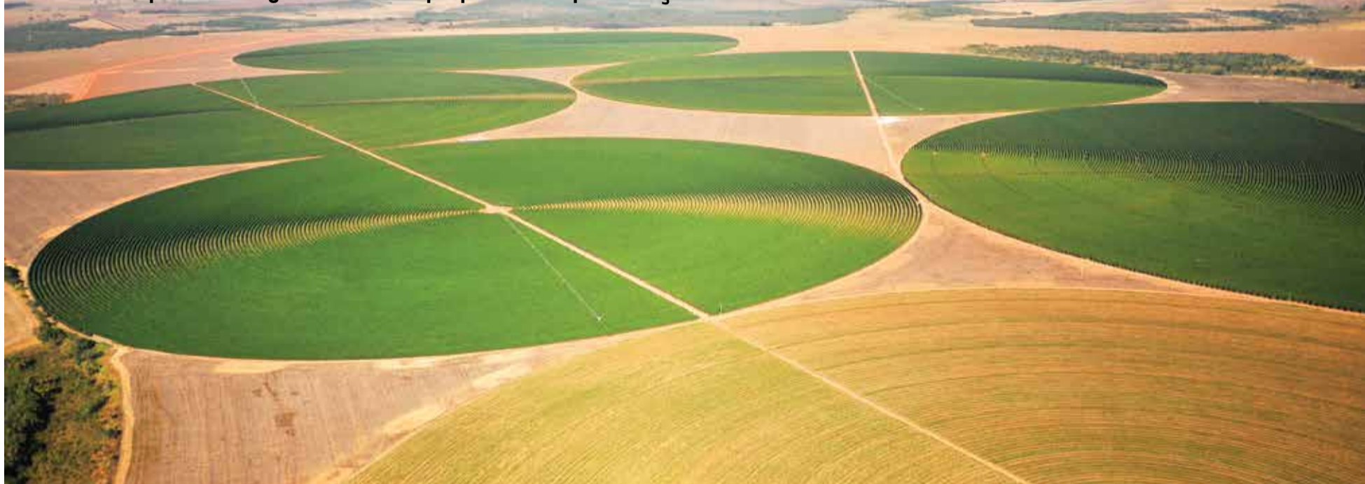
Cristalina tem a maior área irrigada por pivô central da América Latina

Método que utiliza água das chuvas proporciona a perenização dos rios